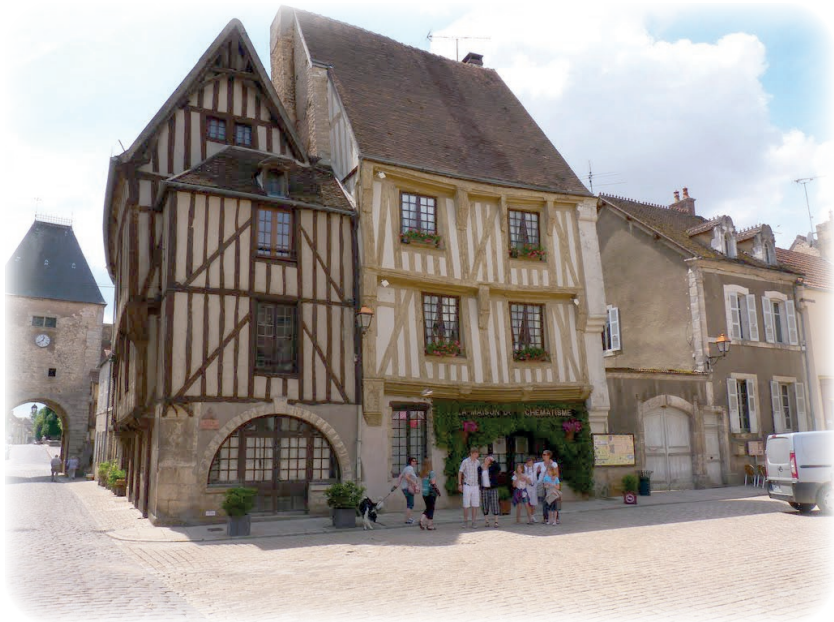
Hôtel du Globe, Noyers-sur-Serein