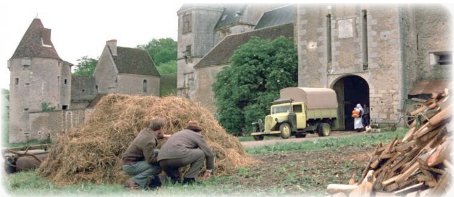
Avant le vol du camion Citroën (capture d'écran du film). Château de Faulin à Lichères-sur-Yonne (Yonne).