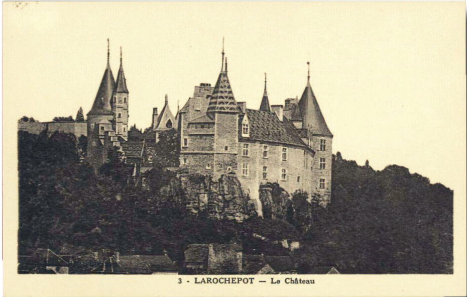
Cartes postale du château La Rochepot (2e quart du XXe siècle, 19 Fi 21527/12)

La Bourgogne, après Paris, se taille la part du lion comme cadre de cette vadrouille (terme apparu à la fin du XIXe siècle avec l'acception de « déplacement »). En Côte-d'Or, d'abord. Les toitures pittoresques du château de la Rochepot servent de cadre au parcours du camion Citroën.