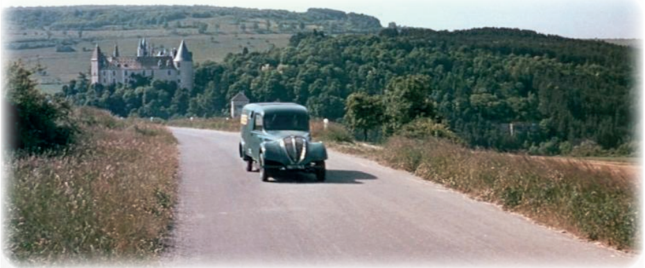
Sur la route de La Rochepot (capture d'écran du film).

Ce sont les équipes du tournage qui ont fait la plus grande vadrouille.