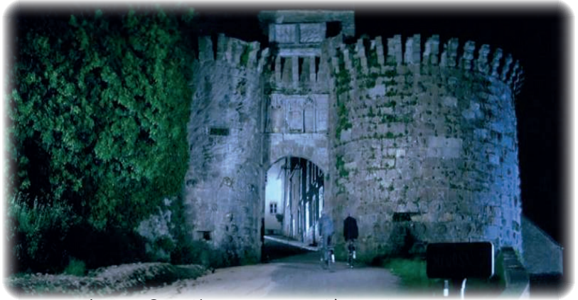
Vézelay, Porte Neuve : entrée de Meursault pour les besoins du film (capture d'écran du film).