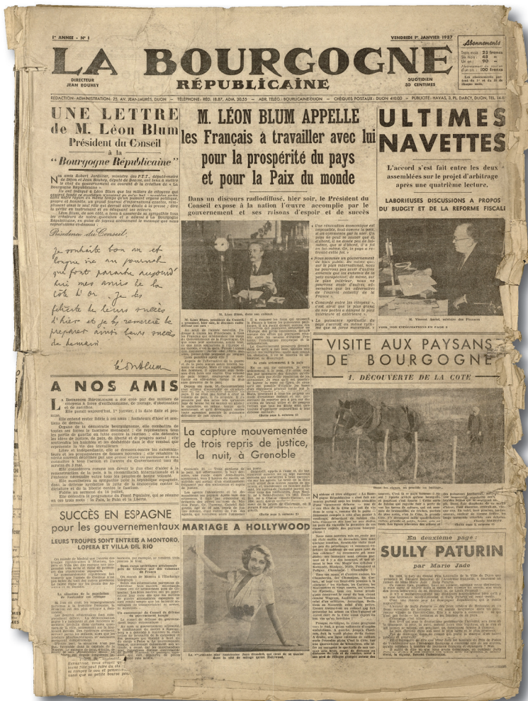
La première une de La Bourgogne républicaine le 1er janvier 1937 (PER 162/1)

Cette femme debout près de la vigne, un panier de vendanges à ses pieds et coiffée d'un bonnet phrygien, c'est l'allégorie de La Bourgogne républicaine , journal socialiste publié à Dijon entre 1937 et 1958/9 (avec une interruption sous Vichy). Faite d'un papier collé sur du bois, cette allégorie avait été mise au rebut sur le trottoir de l'avenue Foch en 1972, au moment du déménagement du journal Les Dépêches (qui avait absorbé La Bourgogne républicaine en 1958) ; récupérée par un amoureux du patrimoine, elle est entrée aux Archives départementales en décembre 2017.