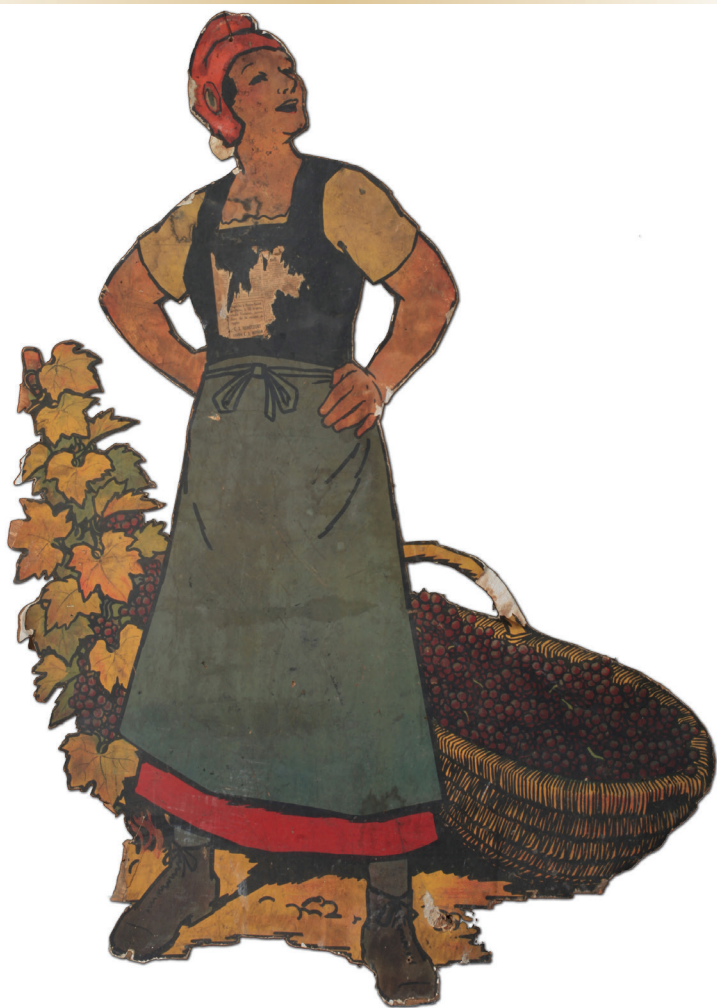
Allégorie de La Bourgogne républicaine (1 Fi 195)