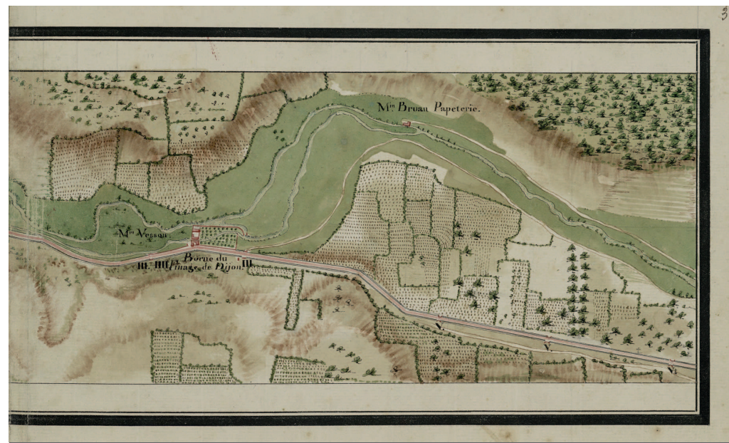
Vers 1759 C 3882/1, plan 33 Deux illustrations : Vue générale et détail