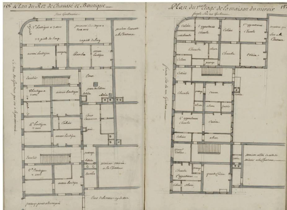
Années 1780 46 H R/728, p. 156-157.

Les chartreux possédaient la maison qui occupait l'emplacement de l'actuel magasin H et M. Construit à partir de 1767 au coin de la rue des Godrans et de la rue Guillaume (ancien nom de la rue de la Liberté), cet immeuble de rapport comportait trois étages et un grenier : 10 caves, cinq boutiques au rez-de-chaussée, cinq appartements aux 1er et 2 e étage, 10 mansardes au 3 e , et 10 greniers au dernier niveau. Le registre des déclarations de terres, prés et maisons de la chartreuse comprennent des plans détaillés.