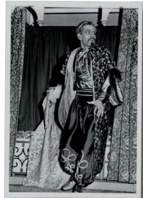
Portrait en pied de Volpone