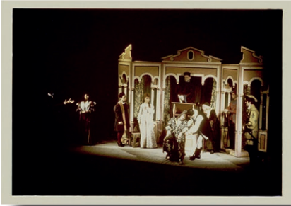
Décor avec les acteurs en action, en couleur