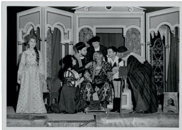
Décor avec les acteurs en action