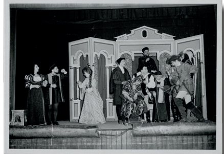
Décor avec les acteurs en action