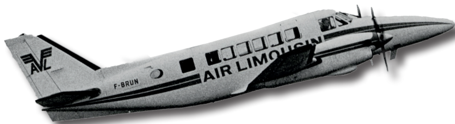
Photographie prise à l'occasion du premier envol le 2 avril 1973 ADCO, 2203 W 24

De la création à la guerre, l'activité semble avoir été à la hauteur des espérances. Après l'interruption due à l'Occupation, l'aéroport est remis en service, avec certaines difficultés. L'activité reprend, notamment avec la mise en place de lignes aériennes pour le transport de passagers.